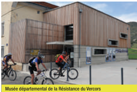
Musée départemental de la Résistance du Vercors

de goûter aux grands paysages. On pourra faire une halte à la Fontaine du Lauzet et son refuge. Après une descente, le circuit conduit au musée de la Préhistoire où une visite permet de porter un autre regard sur ce territoire. C'est enfin sans difficulté que l'on regagne le village de Vassieux-en-Vercors.