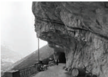
Travaux dans les Grands Goulets au début du 20 e siècle

Spectaculaires et audacieuses, les routes du Vercors ont été construites au 19 e siècle au prix d'efforts considérables. Désenclavant le massif, permettant le lien entre le piémont et le plateau du Vercors, elles doivent leur célébrité à leurs tracés impressionnants taillés au flanc des falaises ou au fond des gorges.